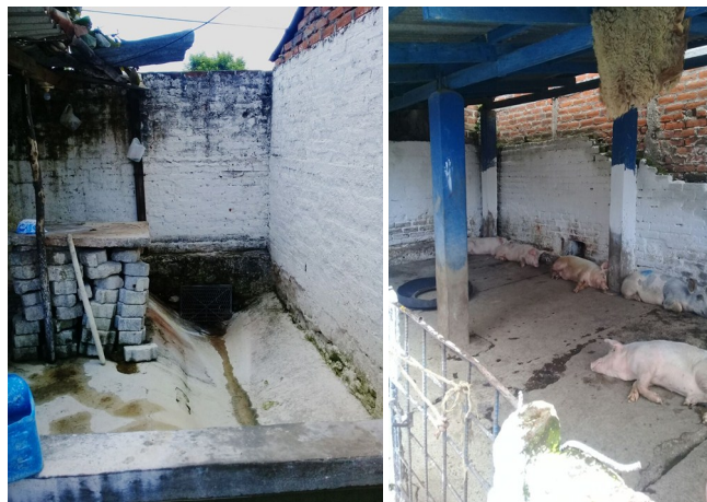
Fotografías tomadas en diligencias de inspección.

En otros temas, el Equipo Multidisciplinario en materia ambiental que apoya a los Jueces Ambientales participó en 4 inspecciones por daño ambiental en los departamentos de Sonsonate, Santa Tecla y Morazán.