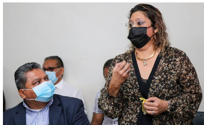
Funcionarios judiciales del departamento de Sonsonate.