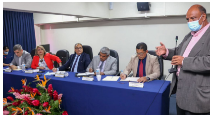
Centro Judicial "Dr. Ángel Góchez Castro", Santa Ana.

Los Magistrados de la Sala de los Constitucional finalizaron las reuniones de acercamiento en la zona occidental, con la visita a los señores jueces del departamento de Santa Ana, específicamente en el Centro Judicial "Dr. Ángel Góchez Castro" de Santa Ana.