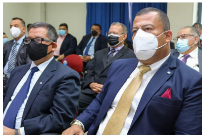
Funcionarios judiciales en reunión en el Centro Judicial "Dr. Romeo Fortín Magaña", Ahuachapán