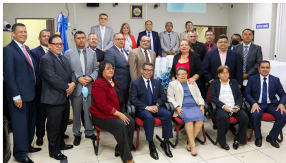
Magistrados de la Sala de lo Constitucional con Magistrados y Jueces del departamento de Sonsonate.

solventar problemáticas a fin de administrar una pronta y cumplida justicia, así como una tutela efectiva de los derechos en favor de los usuarios del sistema.