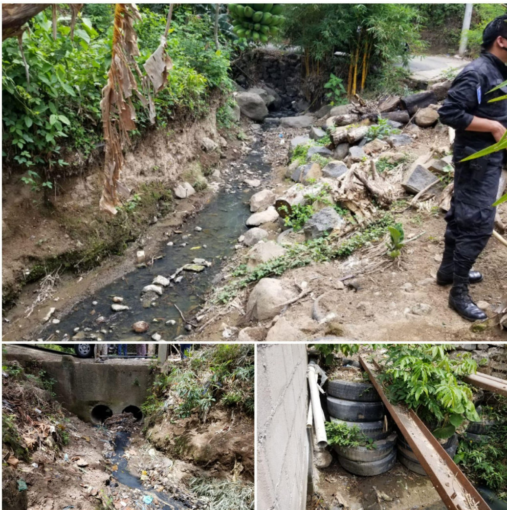
Fotografías tomadas durante diligencias de inspección..