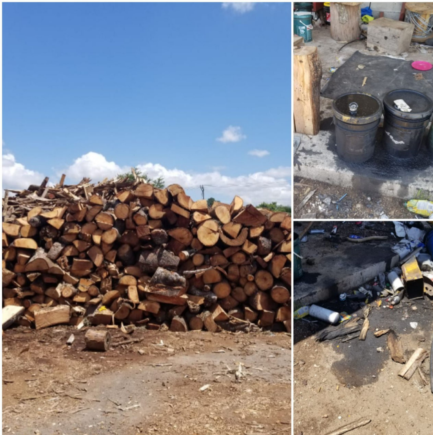
Fotografías tomadas durante diligencias de inspección..