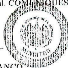
ROGELIO EDUARDO RIVAS POLANCO MINISTRO