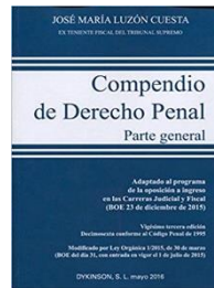
José María Luzón Cuesta 23ª. ed. España, 2016