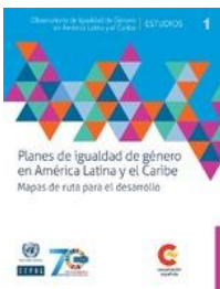
Planes de igualdad de Género en América Latina y el Caribe 1ª. ed., Chile, 2017