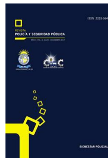
Revista Policía y Seguridad Pública