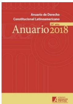
Anuario de Derecho Constitucional