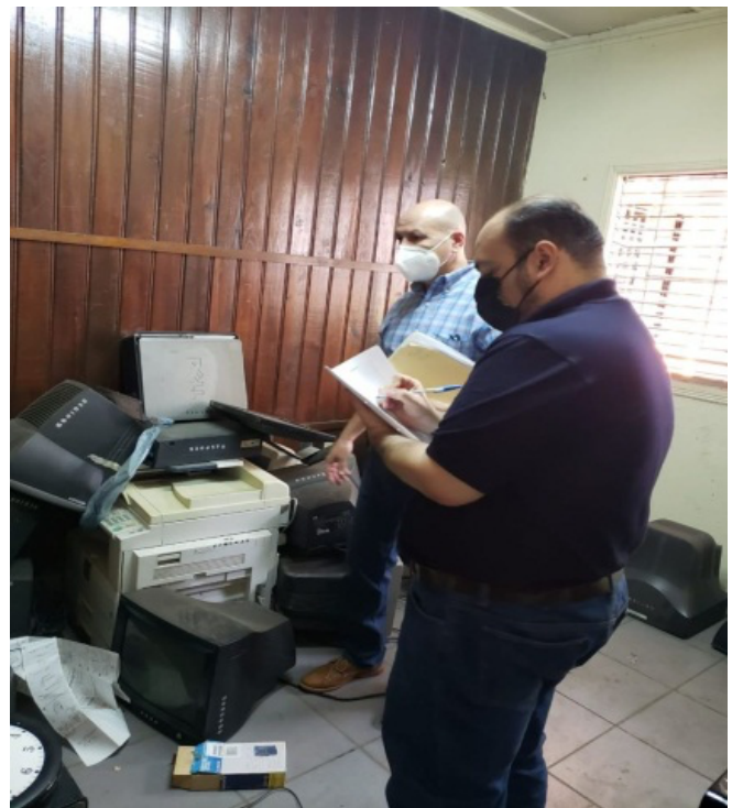
Fotografías tomadas durante las actividades.

El 9 de septiembre de 2021 personal de la Unidad de Medio Ambiente participó, junto con la Administración del Centro Judicial de Santa Ana, en la entrega de bienes contaminantes a empresa autorizada por el MARN para la gestión de este tipo de desechos. Se entregó una totalidad de 1,334 bienes para su reciclaje.